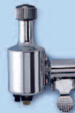
Dynamo Erfinder: Werner von Siemens Deutschland, 1866